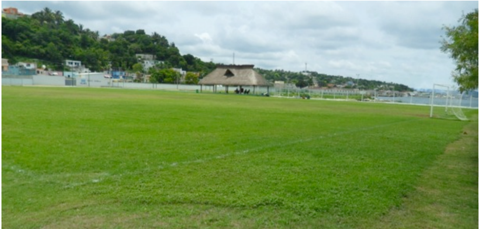
CAMPOS API (2) AV. COSTERA LERMA CAMPECHE