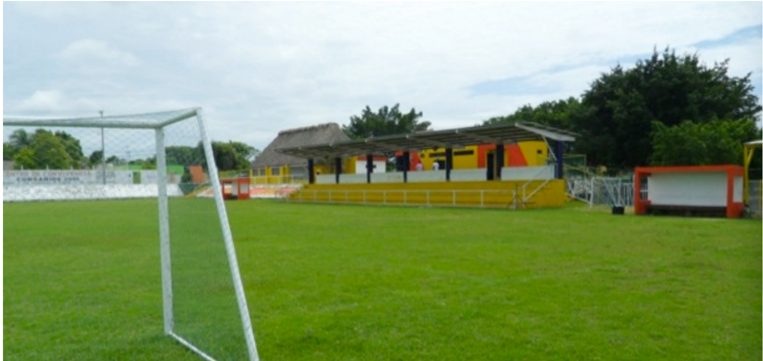
CLUB CORSARIOS 2000 ANTIGUA CARRETERA A HAMPOLOL IMI II