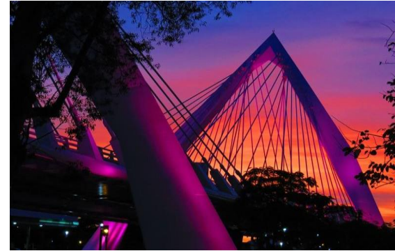
Puente Matute Remus