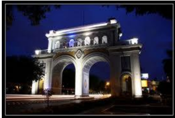
Arcos de Guadalajara